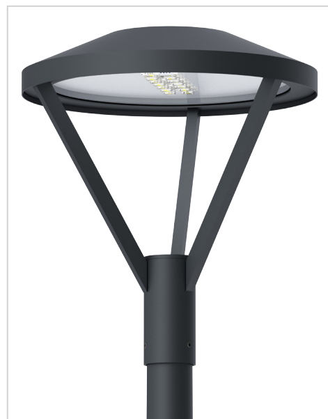
KOBA S 28W / 42W